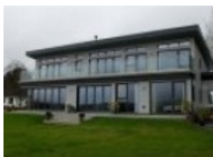
SW11 puitalumiinium tooted Inglismaal, Fishguardis