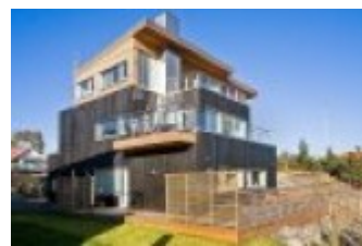
Viking Window aknad ja ukсед Roots