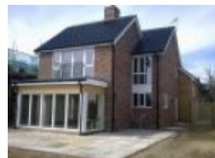
Aknad ja ukсед Whinbush, Inglismaa