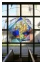
Mustvee kiriku aknad