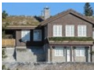
Viking aknad Norras