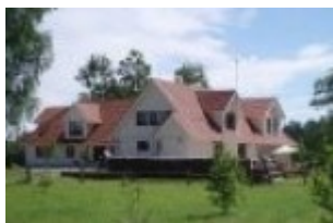
Ärma talu Viljandimaal

Tutvu Viking Windowsi teostatud töödega, klikkides siin: Galerii