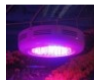
LED lambid kasvuhoonetele ja taimede kodus kasvatamiseks