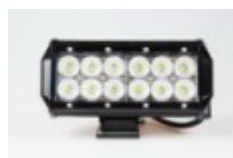
LED work lights