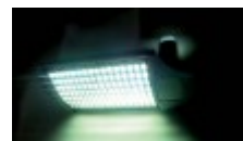
Tänavavalgustus LED valgustiga