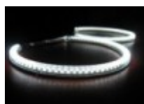
Angel eyes set