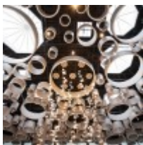
Ülemiste keskuse atriumi akustilised torud