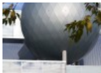
Ahhaa teaduskeskus Tartus

Vaata Parmet AS tehtuid töid klikkides järgnevale lingile: GALERII